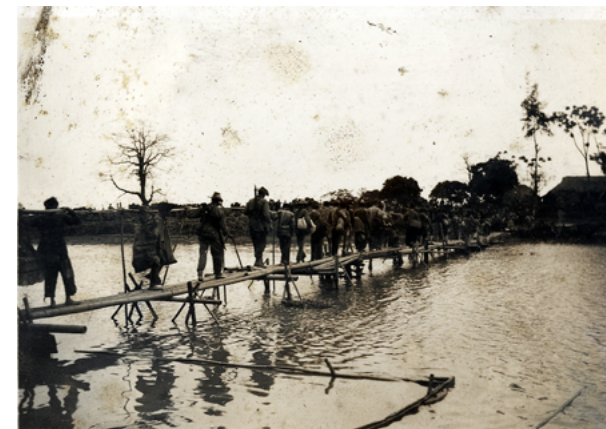
Sapeurs en Indochine