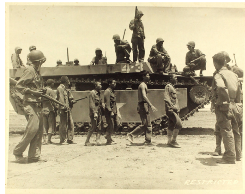
Une équipe de Combat Interview suit les combats de Saipan en 1944