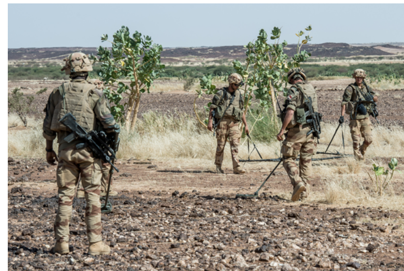
Sapeurs dans la Bande sahélo-saharienne