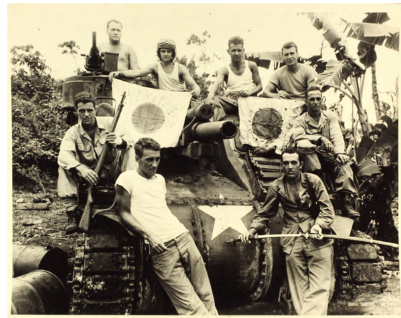
Une équipe de Combat Interview documente les combats de Saipan en 1944

À partir du mois de décembre 1943, le département de la Guerre décide d'élargir l'expérience et les méthodes développées par le général Marshall aux autres théâtres d'opérations. L'Historical Branch G2 s'associe avec le service de relations publiques du ministère pour regrouper les moyens projetables, donnant naissance à une nouvelle structure : Information & Historical Service (I&HS). L'organisation est simple. Des équipes d'historiens, composées de deux officiers subalternes et de deux sous-officiers, sont créées au niveau de la division. Leur mission est de collecter le plus largement possible l'ensemble de la documentation disponible (témoignages, tactique...), puis de la transmettre à la cellule I&HS insérée au niveau du théâtre d'opération afin que les historiens puissent réaliser une première synthèse et un récit. Envoyé à l'Historical Branch G2 de Washington, il est ensuite finalisé avant publication. À la fin de la guerre, l'Historical Branch G2 supervise l'activité de neuf unités I&HS, de